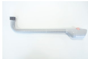
付属のシャワー出湯管 (400mm)

※800mmの出湯管も関連商品でご用意しています。 (希望小売価格 8,000円)