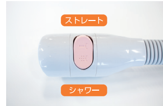
シャワー／ストレート 切り替えボタン